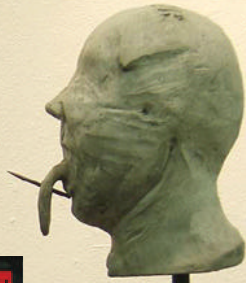
Lenguasafiladas Adán Sáenz