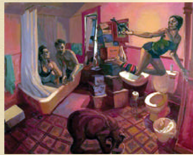
Misconception of the Innocent