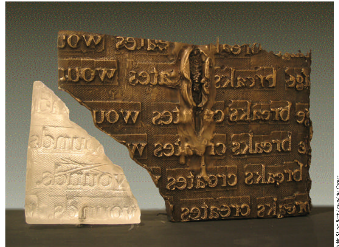
Adán Sáenz: Back Around the Corner.